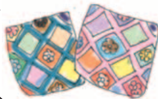
クッションカバー